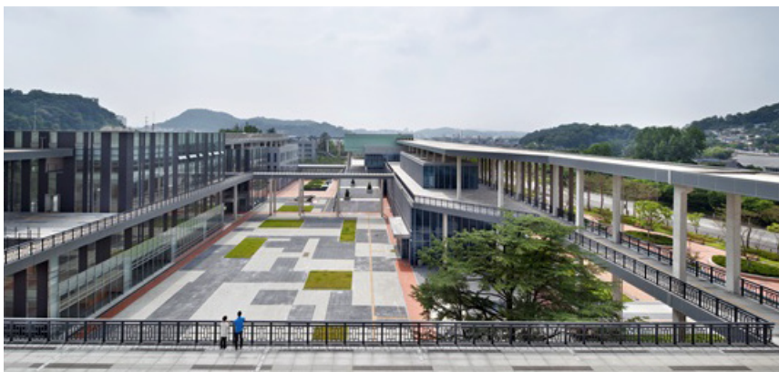
〈그림 2〉 국립무형유산원 전경