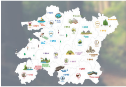
〈그림 3〉 전라북도 생태관광지 현황