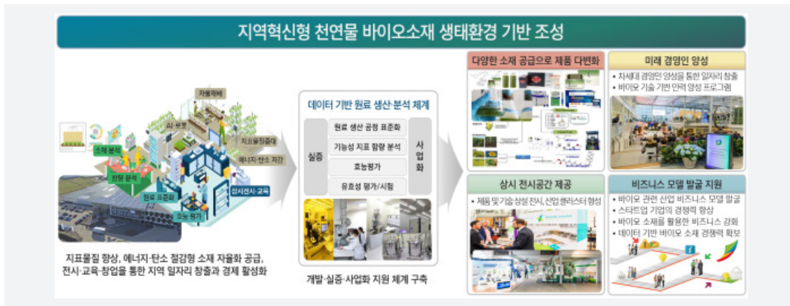
[그림 5] 천연물 기반 바이오화학산업 클러스터 기반 구축