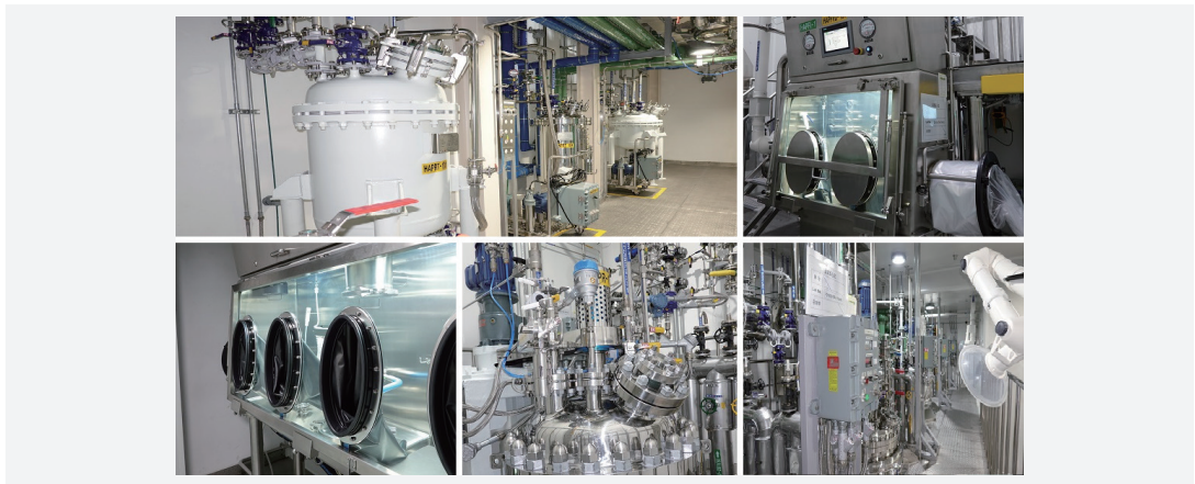
[그림 4] Pilot 규모의 바이오화학 공통 기반시설