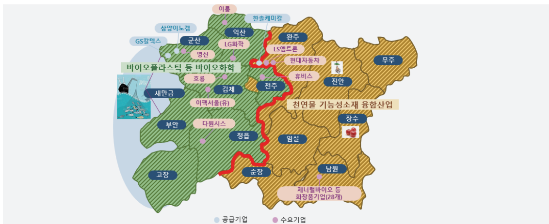
[그림 1] 권역별 구축 인프라 및 자원을 연계한 지역 바이오 특화 분야 육성